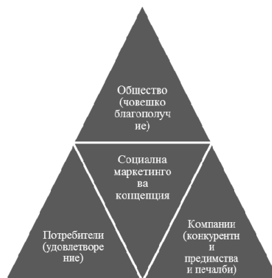
Фигура 4. Роля на социалната маркетингова концепция

Социалната маркетингова концепция насърчава бизнеса да осмисли своята маркетингова философия от гледна точка на съвременните реалности и да предприеме действия към изграждане на социални и етични норми в своята маркетингова практика. Ако бизнесът приеме това предизвикателство ще трябва да балансира между три конфликтни цели – фирмена печалба, задоволяването на потребителите и обществения интерес . Голям брой фирми постигат забележителни продажби и печалби чрез адаптиране и прилагане на социална маркетингова концепция.